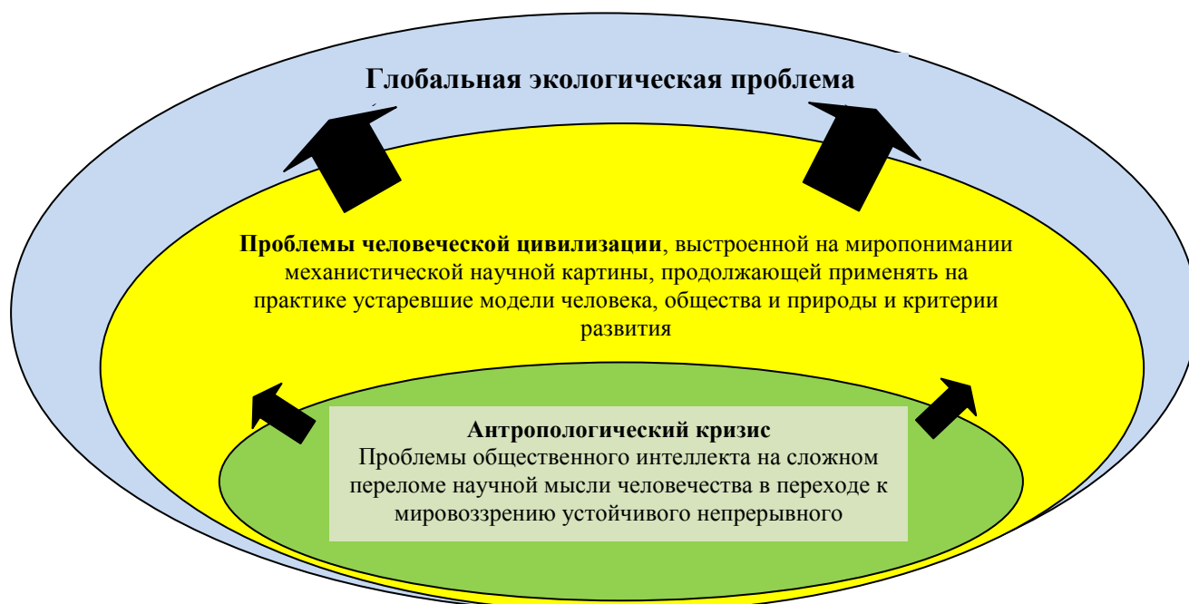
Рис. 2. Глобальная экологическая проблема

Было бы логично предположить, что парадигма развития человеческого общества должна содержать самые последние знания о Природе, Человеке и Обществе (рис. 2). И только в этом случае возможно адекватное разрешение накопившихся разнообразных проблем человечества [4, с. 112].