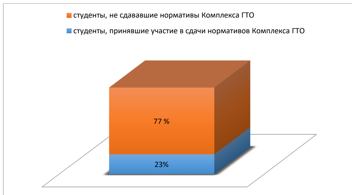
Рисунок 1. Охват студентов внутривузовского этапа проекта «От студзначка к знаку отличия ГТО»

Для популяризации ГТО в систему физического воспитания и студенческого спорта университет «Дубна» несколько лет включает соревнования по нормативам 6 ступени в различные спортивные праздники, программу Универсиады студенческого спорта. Каждый месяц в ФОК «Олимп» проводят «День ГТО», день сдачи различных нормативов для студентов и работников университета. В сентябре 2018 года прошел внутривузовский этап проекта «От студзначка к знаку отличия ГТО», в котором приняло участие 380 студентов с 1 по 3 курс (рис 1.). Таим образом 23 % студентов сдавали 6 нормативов (3 основные и 3 по выбору).