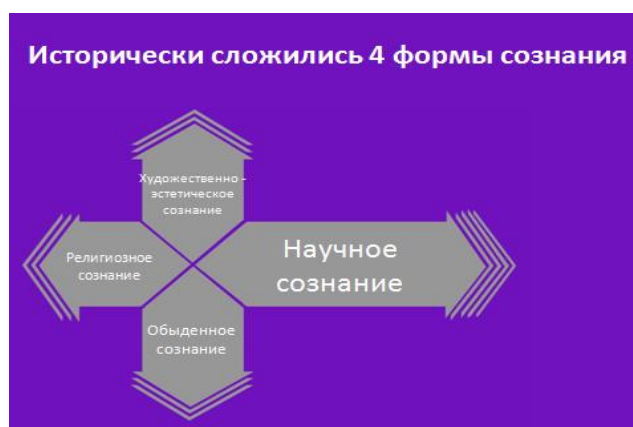
Рис. 1. 4 формы сознания в человеческом обществе.

1. Сознание, качественно адекватное природе человека является естественным для него. Мы называем его природосообразным или целостным сознанием . Выбрав тот или иной предмет познания, человек, не нарушая законы природы, законы информации, законы собственного тела (мы убедимся, насколько это важно!) и нейрофизиологические законы устремлён к познанию сути.