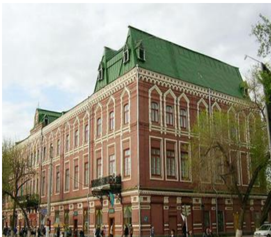
Рис. 3. Дом Караяевых, современный вид

Жилой дом принадлежал богатому уральскому купцу Кареву. В 1900 году на пересечении улиц Большая Михайловская и Мостовая в городе Уральске было построен этот жилой дом. Дом Карева выделяется среди старых застроек города своим величием и размером, занимает почти целый квартал, тремя необычно высокими этажами и как будто еще один этаж с интересной высокой крышей. Если идти вдоль знаменитой улицы Достык (в данный момент проспект Н. Назарбаева), на углу улицы Карева вы увидите трехэтажный, окаймленный крышей с высокой башней на вершине «Дом Карева» Фасад здания выложен узорным кирпичом без штукатурки. Поэтажное деление выполнено горизонтальной тягой по всему периметру здания-кромкой междуэтажных перекрытий, вертикальное деление обрамлено пилястрами. Рамы окон второго этажа сделаны из кирпича, а третьего этажа – из рам, кромки, косяков. Кружевные балконы на затейливых чугунных кронштейнах притягивают взгляд. Окна последнего этажа решены в виде арочной кромки. Это единственное здание в Уральске, построенное по русской кирпично-каменной кладке [4].