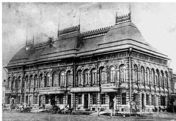
Рис. 2. Дом Ванюшиных (1880 год)