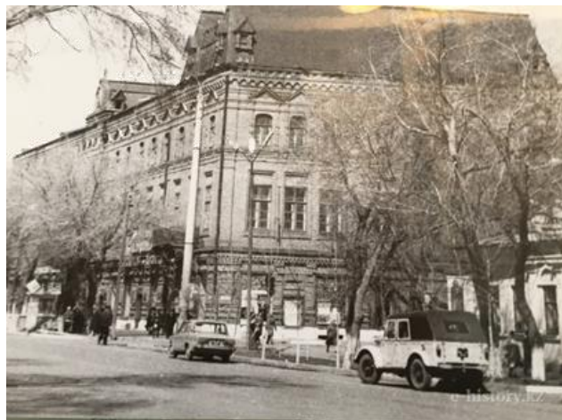
Рис. 4. Дом Караяевых (1980 год)