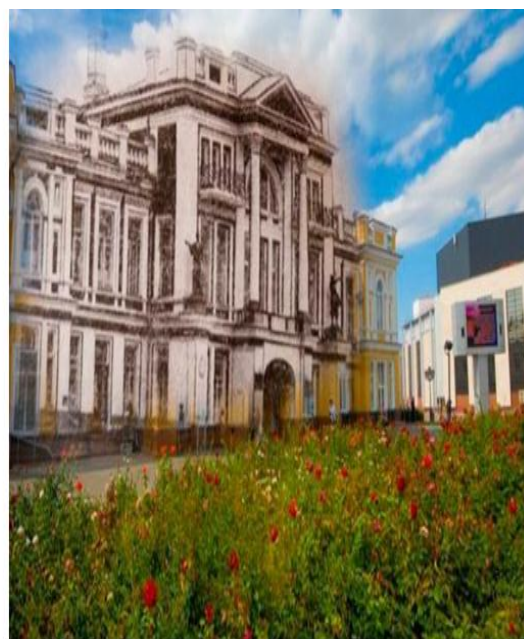
Рис. 6. Областной акимат (1904 год постройки), современный вид

Памятник архитектуры XIX века стоит на том же месте, ранее это была площадь Туркестанская, ныне носит название великого мыслителя Абая. До революции в этом трехэтажном здании находился Русский торгово-промышленный банк. Первый этаж - подвальный, второй почти вровень с тротуаром - для магазинов, а третий - для банка и биржи. В здании банка находились аптекарский магазин Компанейца, магазин купца Р. Функа, парикмахерская Грязнова, коммерческая чайная, ресторан, биржевой зал, квартира управляющего банком. Коммерческий банк горожане называли «белым банком». В настоящее время слева от главного входа – помещение нотариальной конторы, справа – магазин. Впереди, перед входом, между колоннами на некотором возвышении установлены фигуры львов. На правой стороне лев, опирающийся на герб Уральского казачьего войска, а на левой – с гербом Уральской области. Здание было построено в стиле ренессанс, из камня и железа, и облицовано белым кирпичом. Здание банка по периметру опоясывала ажурная ограда декоративного рва. Богатая лепная и цветная пластика фасада органично сочеталась с изящными решетками балконов. Изюминкой здания явился выдвинутый вперед портал, украшенный колоннами со скульптурами.