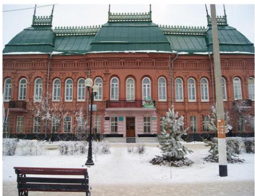
Рис. 1. Дом Ванюшиных, современный вид

К архитектурным элементам (архитектурным деталям), выполняемым из кирпича относят: контрфорсы; полуколонны и колонны; эркеры; фронтоны; ризалиты, пилястры, пояски, сандрики, карнизы, кронштейны, русты, ниши.